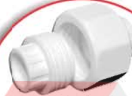
Pipe union both side welded مهره ماسوره دو طرف جوش مۆرهی ماسۆلهی دوو لاجۆش صمۆله به ماسوره ملحهه فی الجانبین