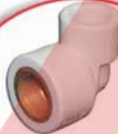
Female threaded elbow زانو یکسر پوشن فلزی سی ریان پوشنی کانزایی دیواری کوع انثی