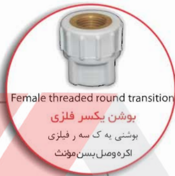
Female threaded round transition

بوشن یکسر فلزی بوشنی یه ک سه ر فیلیزی اکره وصل بسن مؤنث