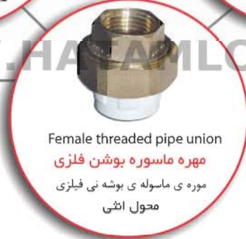
Female threaded pipe union مهره ماسوره بوشن فلزی موره ی ماسوله ی بوشه نی فیلیزی محول اثنی