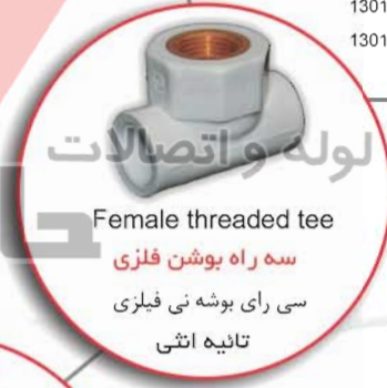
Female threaded tee سه راه بوشن فلزی سی رای بوشه نی فیلیزی تائیه اثنی