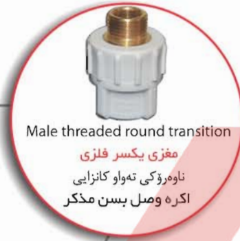
Male threaded round transition

مغزی یکسر فلزی ناوهرژی ته‌واو کانزایی اکره وصل بسن مذکر