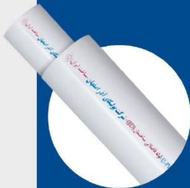
Soil and Waste Pipe