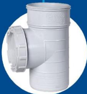
Clean out Tee