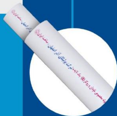
Rain Water Pipe