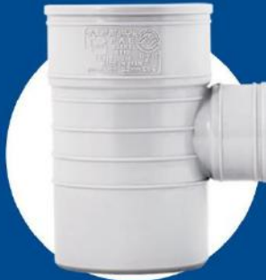
Reduce 90-degree Tee