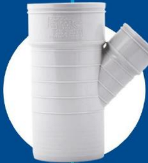
Reduce 45-degree Tee